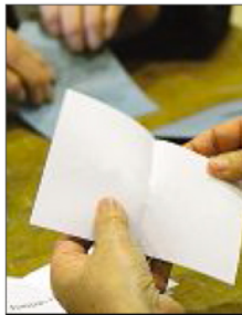
BLANC. Bulletin sans nom, ou une enveloppe vide !

Le scrutin européen sera le premier à éterniser la nouvelle prise en considération du vote blanc. Depuis 1852, ce dernier était