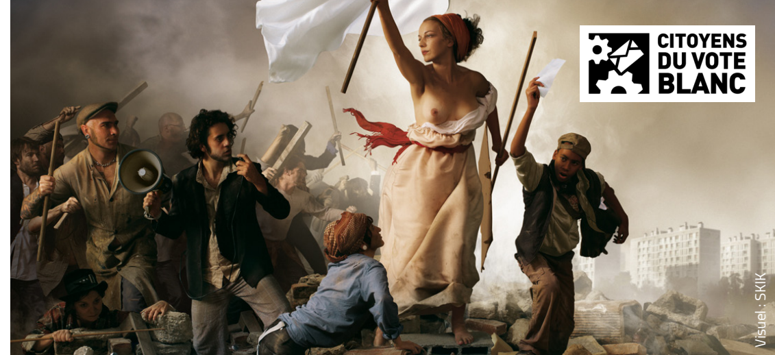
Visuel : SKIK